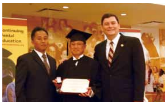
南カリフォルニア大学の卒業式。キャップ&ガウンの正装で

す。都内の歯科医院では、わずか2.7%しか認可されていません(2010年10月現在)。 その他に「最新の歯科用CTによる正確な検査・診断」「レーザーメス切開とデジタルモニターによる術中状態の把握」「大病院と同じレベルの滅菌器を導入した院内感染対策」「マイクロスコープによる精密治療」などもあります。 総合的な治療が、設備の整った安全な環境で高い技術と経験により実施されています。