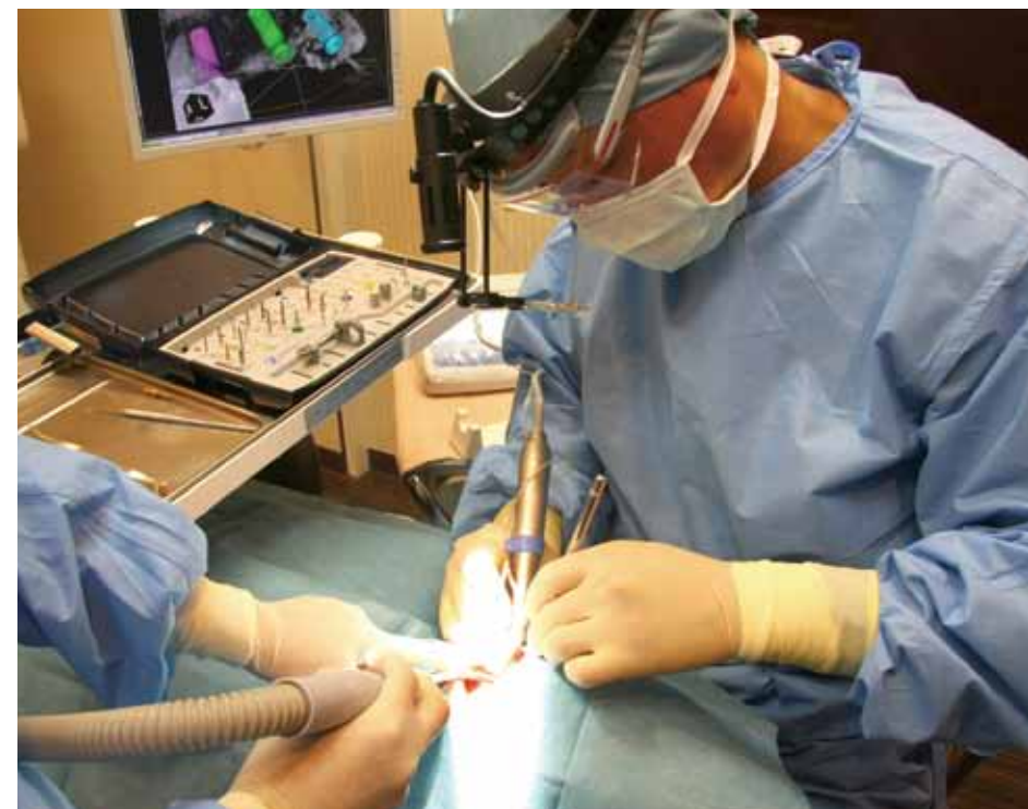
CT、レーザー、ピエゾサージェリー、マイクロスコープ、デジタルモニターなど、最先端の設備を駆使したオペ