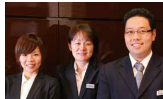
ホスピタリティにあふれた受付スタッフ

宇田川先生は現在、全米の歯学部で最も歴史のある南カリフォルニア大学客員研究員で、2010年9月には同大歯学部准大学院を卒業されました。また、国内外の各種学会、講習会へも積極的に参加しています。