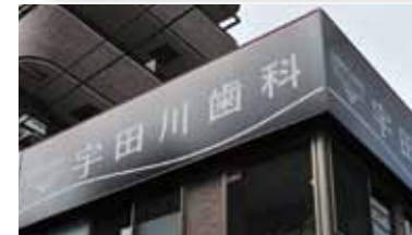
錦糸町駅から徒歩にありながら、目の前は錦糸公園という恵まれた環境